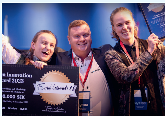
Inission innovation award