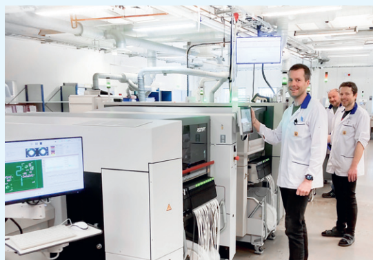
Investeringar för ett hållbart helhetserbjudande