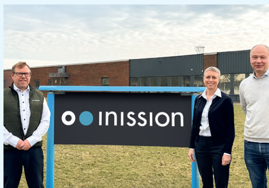
Miljömedvetna bolaget Bintel valde Inission