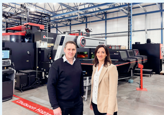
Utrustning värt 2 MEUR lanserat i Tallinn