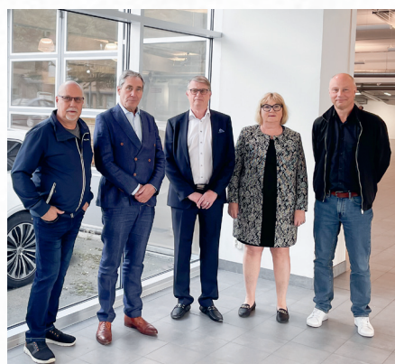
Inission Syd expanderar med ny fabrik i Borås.

Den 13 juni meddelade Inission att Inission Syd AB, expanderar i västra Sverige med en ny fabrik i Borås. Fabriken kommer att fokusera på LEAN och erbjuda en arbetsmiljö som prioriterar kunder, kreativitet, samarbete och teknik. Med den nya fabriken får Inission Syd, med fabriker i Malmö och Borås, en total kapacitet på över 10 500 kvm och fyra ytmonteringslinor. I projektet deltar Inissions samarbetspartner Part Development. Inflyttning är planerad i mars 2025.