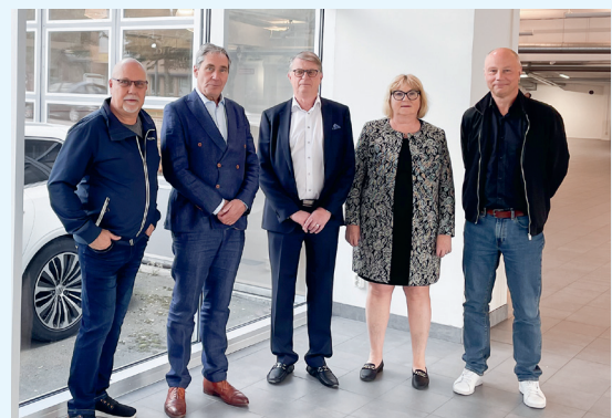
Inission Syd expanderar med en ny fabrik i Borås.