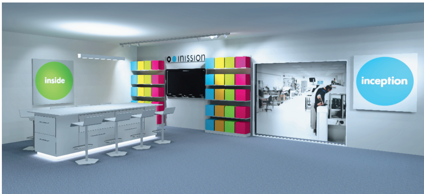
Inission Stockholm showroom. Insides avdelning med material och komponenter vägg i vägg med Inceptionavdelningen.