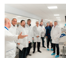
Bilder från invigningen av Inission Stockholm AB