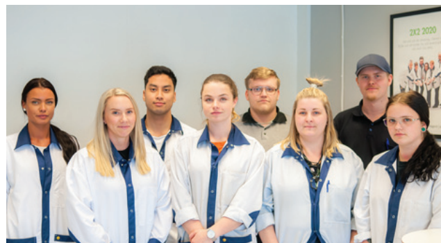
Inission har under perioden satsat hårt på att utbilda sina medarbetare att löda och bedöma hållbarhet och kvalitet för lödningen enligt den kvalitetsklass som kunden föredrar.