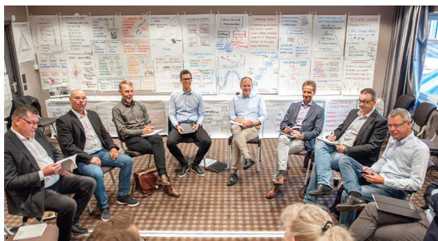
I juni startade Inission Academy med ett skräddarsytt ledarskapsprogram för Inissions ledning och fabrikschefer.