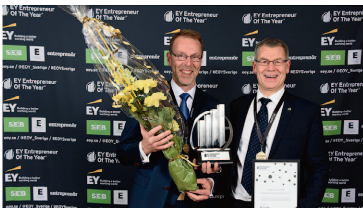
EY entrepreneur of the year sida 5