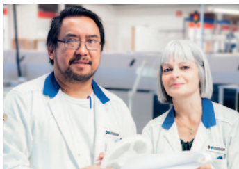
Verksamheten sida 4