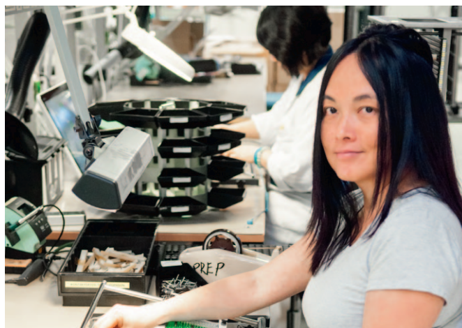
Bilder från Inissions verksamheter i Malmö och Borås.