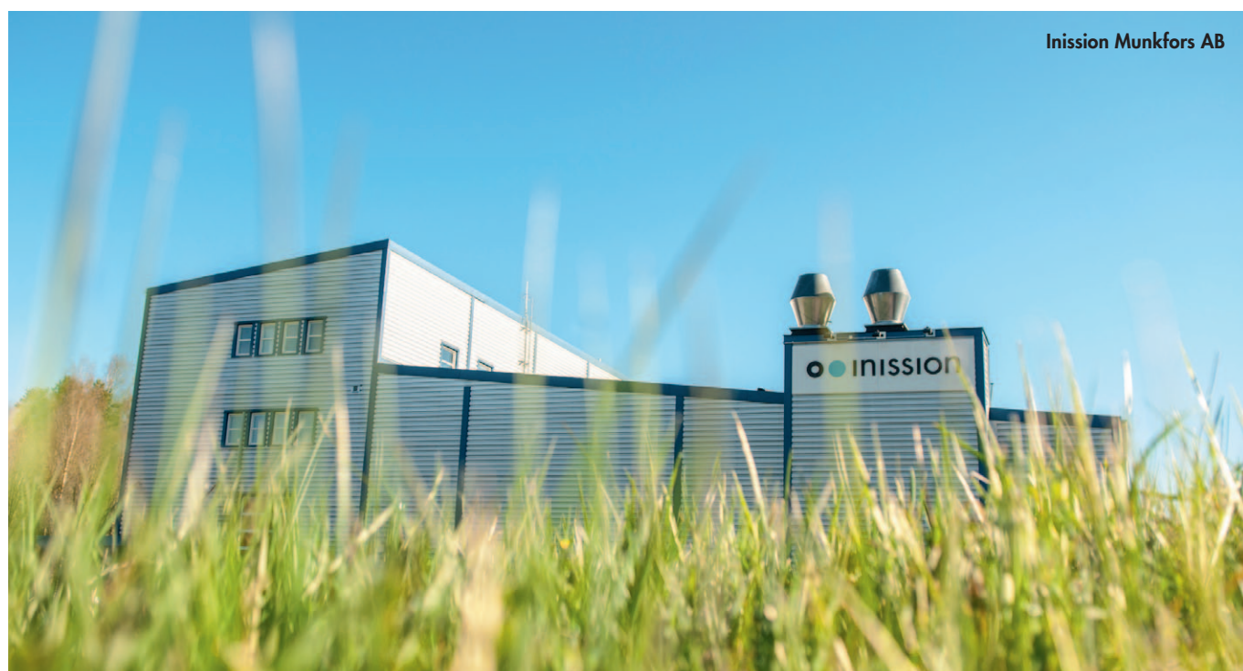
Inission Munkfors AB

En komplett fabrik med ett flexibelt och kundnära erbjudande till kunder i Göteborgsregionen. Inissions största fabrik sett till personal och omsättning. En del av Inission sedan juni 2016. Har funnits i branschen i 25 år.