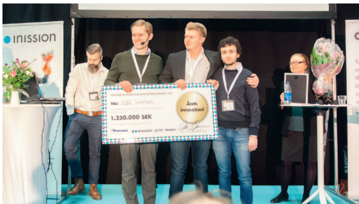
Inission innovation award sida 5