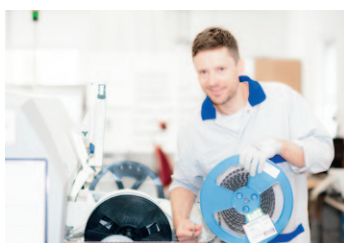
Förvaltningsberättelse sida 9