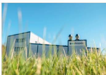
Koncernstruktur sida 11