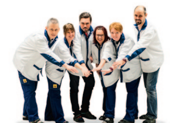
Adresser sida 42