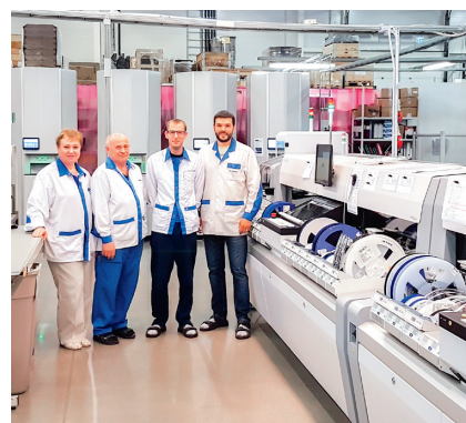
Den nya Mycronic SMT-ytmonteringslinan hos Inission Tallinn och laget bakom installationen.